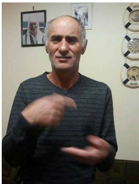
כאן הוא אומר את הביטוי עוד פעם

מבוא החירשות התקשורת החיים והמנהגים המשפחה החברה והקהל חקר אישי השפה של אבא דיון סיכום ביבליוגרפיה