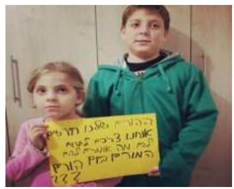
ילדים שומעים להורים חרשים