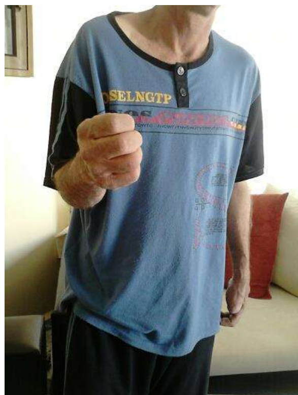
כאן הוא אומר שהוא רוצה לשתות חלב

מבוא החירשות התקשורת החיים והמנהגים המשפחה החברה והקהל חקר אישי השפה של אבא דיון סיכום ביבליוגרפיה