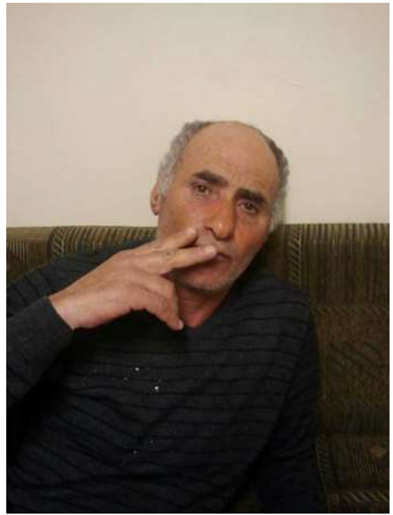
כאן הוא אומר שהוא רוצה לעשן