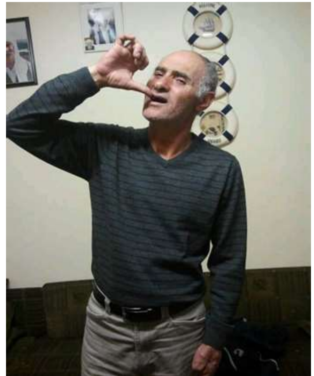
כאן הוא אומר שהוא רוצה לשתות מים