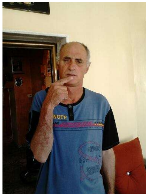
כאן הוא אומר שהוא רוצה לדבר או מבקש שנגיד למישהו משהוא