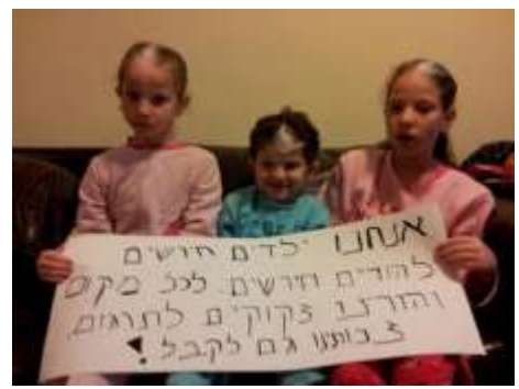
ילדים חרשים להורים חרשים

מבוא החירשות התקשורת החיים והמנהגים המשפחה החברה והקהל חקר אישי השפה של אבא דיון סיכום ביבליוגרפיה