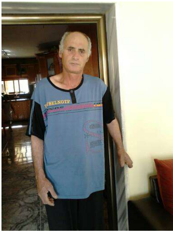
אבא שלי שהוא בעל הבעיה

מבוא החירשות התקשורת החיים והמנהגים המשפחה החברה והקהל חקר אישי השפה של אבא דיון סיכום ביבליוגרפיה