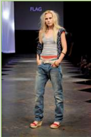
דוגמנית לבגדי טום-בוי

ליטל רוזנשטיין (רוזנשטיין, 2009) קובעת כי מי שנחשבת טום-בוי באופנה היא האישה שלובשת טישרט רגיל, או שמלת מיני. היא נראית כטום-בוי, והיא משקפת משהו פשוט, קליל, טבעי ונערי. לנשים האלה שמתלבשות כך, יש מראה נערי וסקסי יחד. יש במראה שלהן משהו פשוט, לא מתאמץ ויחד עם זה הכי יפה.