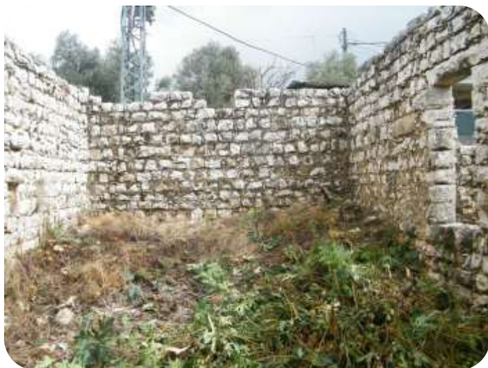
שרידי הכנסייה הקתולית בעין קניה