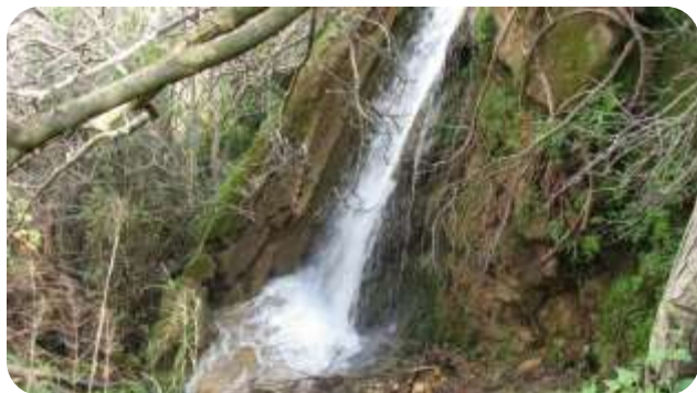
מעיין אל שללה

אחד מתושבי עין קניה טוען שמעיין אל שללה הוא מעיין שנבע בעבר. כל מי שעבר ליטו, שתי מהמים שלו, ונהנה מנופו. הרועים היו מבקרים במקום, במיוחד תושבי זעורה ועין פית, על מנת להתרחץ ולהשקות את הפרות שלהם. אבל באוקטובר 1993 הוא נחפר, ויותר לא נראה. כיום, מי שרוצה לראות את המעיין הזה, צריך לרדת אל המפל הראשי שלו. אפשר לראות שם מפל יפה, מי שצופה בו נהנה מהמראה הנהדר שלו. אבל היום הוא אבד, המים הוכנסו לצנורות, הזקנים בכפר מקוננים על שאיבת המים, כי הבנים שלהם והנכדים שלהם לא יודעים את המשמעות הגדולה של המעיין הזה, למרות שהוא מעיין חשוב מאד בכפר. מעיין "אל שללה" היה נמצא על שטח של 550 מ' מרובע, בעבר היו אוגרים את המים של המעיין, ומכוונים אותם לתעלות כדי להשקות את העצים בשטחים. ליד המעיין היה בית בד של ענבים, ורוב הענבים של הכפר היו נסחטים בבית הבד הזה.