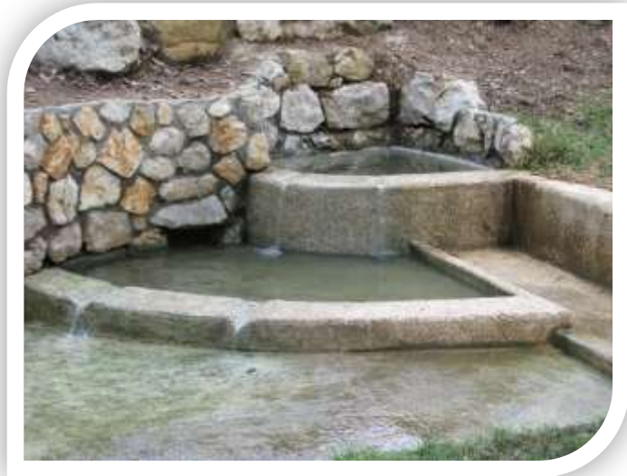
מעיין בתוך פארק עין הריחאן