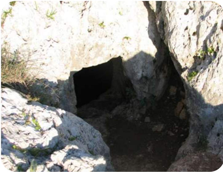
מערת שיח' עותמאן אלחזורי ליד עין קניה