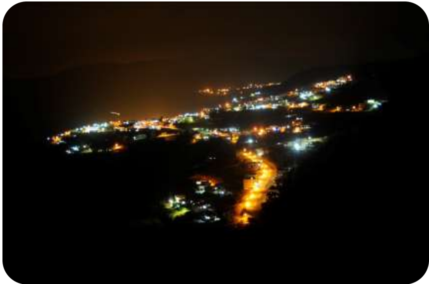
הכפר עין קניה בלילה (הוא נראה כמו מטוס)

עין קניה הוא כפר דרוזי שנמצא ברמת הגולן, הוא הוכרז כמועצה מקומית בשנת 1982. עד שנת 2010, היה מספר התושבים בו 1,766, והמספר גדל בקצב גודל של 5.9%. המילה קניה פירושה "ברוש", כנראה ששמו של הכפר מקורו עצי הצפצפה הרבים שהם בצורה של ברוש. יש דעה אחרת שפירוש המילה קניה הוא "תעלת מים" בגלל תעלות המים הרבות בה. הכפר נמצא בקרבת החרמון ונחל סער, הגובה שלו 750 מטר מעל פני הים. והוא קיים באותו מיקום כבר מאות שנים. בכפר נמצא כמה מקומות קדושים ששייכים לדרוזים כמו קבר שעונה ובתו של יתרו.