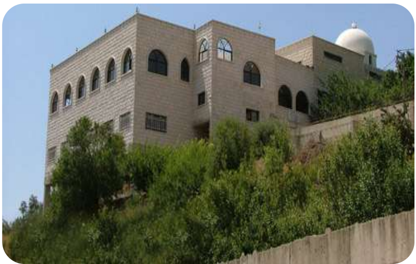
מקאם קבר סת שעואנה בעין קניה