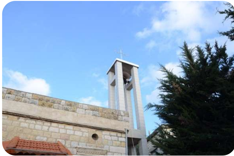
כנסית מר גריס

הנוצרים היו חלק מהחברה בכפר, בזכויות ובחובות, הם השתתפו בפרויקט הכשרת האדמות של מג'דל שמש, וקיבלו שטחי אדמות בכפר לא פחות מהאחרים וזה מעיד על השוויון שהיה בין שתי הדתות. עוד לפני המהפכה הסורית נגד הצרפתים נפתח בית הספר הראשון במג'דל שמש ביזמה של הנשיאות של הקהילה הנוצרית בכפר. בית הספר הזה קיבל אליו תלמידים מדתות שונות, כדי ללמוד ולדעת. עד היום יש עתיקות של כנסיה שנשארה במג'דל שמש, ויש שטחי אדמות רבים לנוצרים, שנמצאים בהשגחה של הדרוזים.