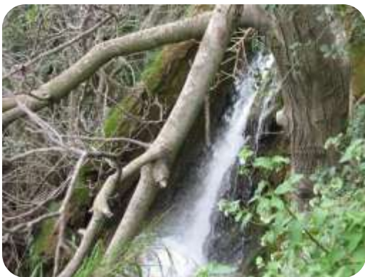
מעיין אל שללה