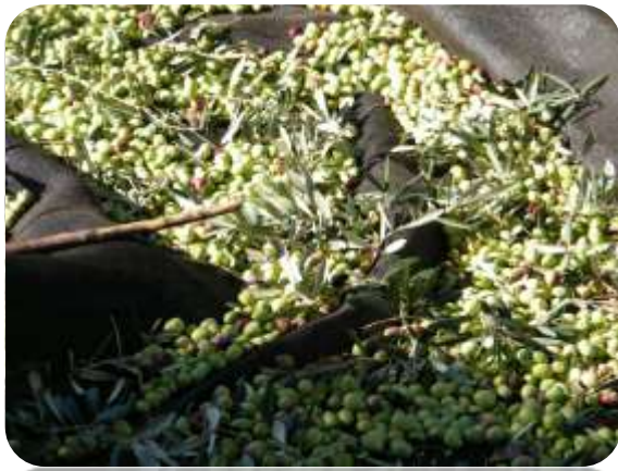
הזיתים נקטפים ונופל על המזרונים

קטיף הזיתים מתחיל בנובמבר ונמשך חודש או יותר. הזיתים ושמן הזית בעין קניה ידועים בטעמם המיוחד ויש להם ביקוש רב, למרות שמחירם יקר. הם מבוקשים במיוחד אצל תושבי הגולן שמעדיפים אותם על פני שאר סוגי הזיתים. למרות הנוכחות של בתי בד עתיקים לזיתים עד הבניאס, אין היום בתי בד בכפר, למרות שהזיתים הם מקור חשוב לפרנסה.