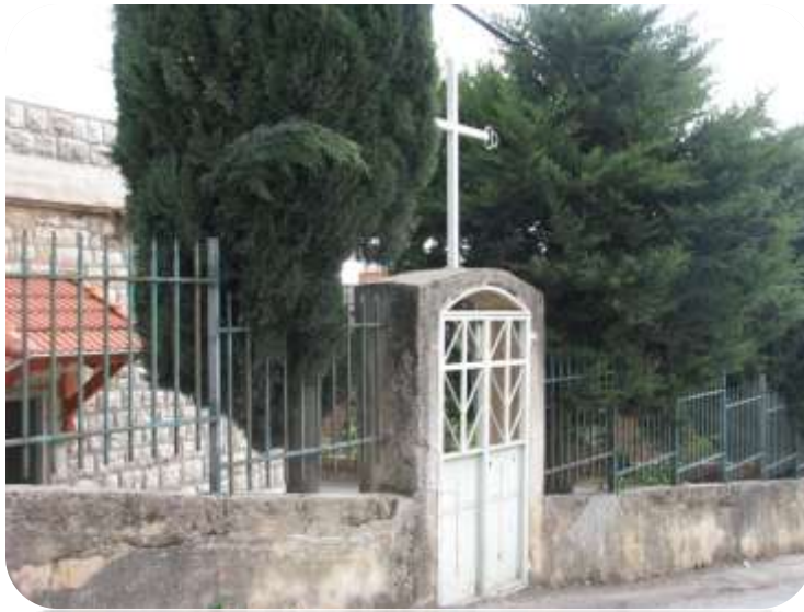
כנסיית מר גריס

הנוצרים עסקו במסחר זעיר ורובם היו משכילים ודיברו שפות שונות, כמו אנגלית וצרפתית. הם גרמו לשיפור המצב הכלכלי עם הקהילות האחרות ותרמו לבניית בתי ספר יסודיים. בשנות ה-30-20 של המאה ה-20 חלק מהמורים עסקו בהוראת הכתיבה והקריאה בהתנדבות, בכיתות הלימוד.