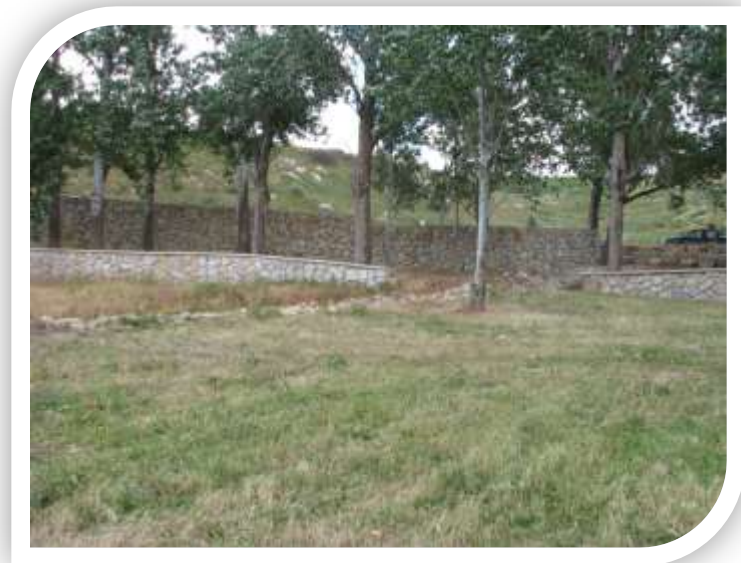
פארק עין הריחאן בתוך הכפר

פארק עין הריחאן נמצא בצפון הכפר, הוא נבנה בשנים האחרונות, יש בו נביעה של מים ועצי ברוש ואקליפטוס, והוא מקום יפה מאוד לטיולי משפחות.