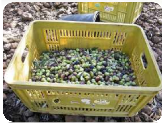
הזיתים בקופסאות פלסטיק