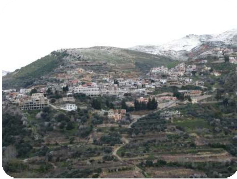
כפר עין קניה בחורף