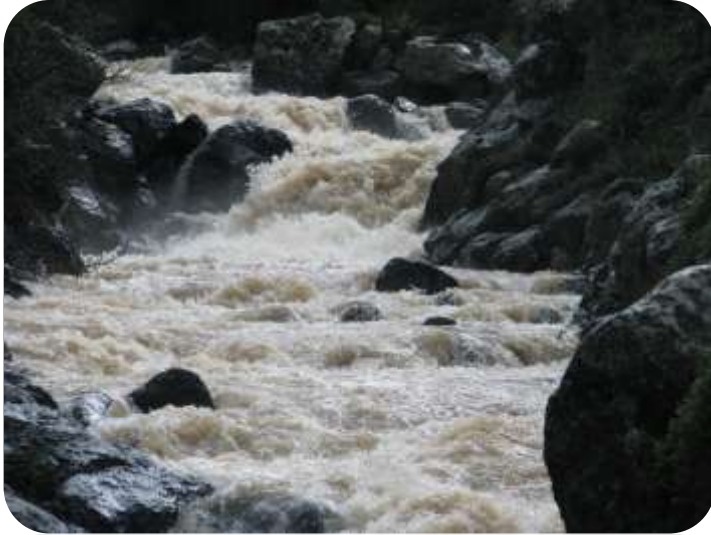
נהר סער בכניסה של הכפר

בצמחייה הטבעית של נחל סער נפגשים צומח הבזלת של הגדה הדרומית עם צומח הגיר והחוואר של הגדה הצפונית, ומעט צומח-נחלים (בעיקר הרדוף) באפיק. בגדה הדרומית (במפנה צפוני) הצומח הוא חלק מיער אודם, המותאם למבנה צפוני תלול: חורש צפוף מאוד וגבוה למדי בשליטת אלון מצוי עם אלון תולע, אלה ארצישראלית עם אלה אטלנטית, הרבה אחירותם החורש, עוזרר קוצני (וגם עוזרר חד-גלעיני), אגס סורי, ער אציל ולבנה רפואי. בתת-יער מתבלטת שרכיה אשונה מפותחת ושופעת. בגדה הצפונית גולש צומח מורדות החרמון. בקטע שבין עין קניה למפל רסיסים נחשף במפנה זה סלע חווארי, ועליו עולה חורש בשליטת אלון התולע, עם הרבה סחלביים.