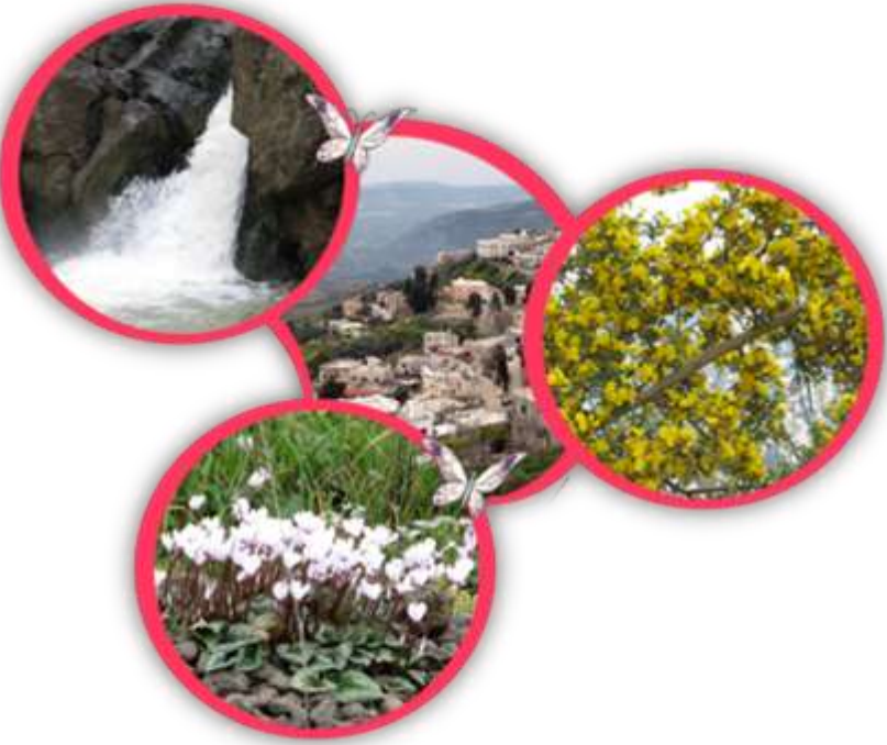
הטבע בכפר עין קניה

בתחומי האיזור היו בעבר כמה ישובים קטנים, וכיום הכפר הדרוזי עין קניה שוכן בגבולו המזרחי.