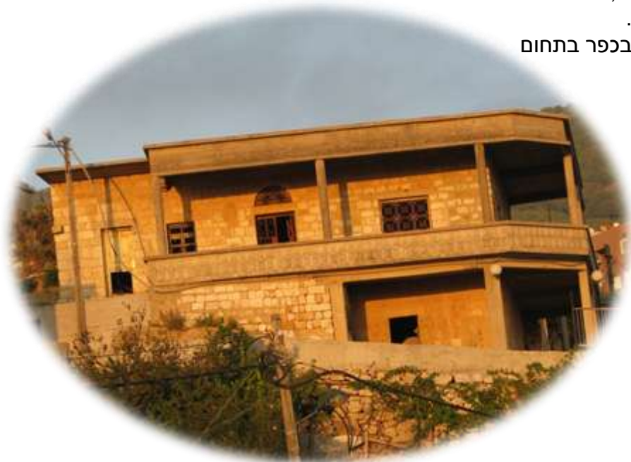
בית עתיק ועזוב בכפר נבנה לפני עשרות שנים

הכפר עין קניה הוא מהכפרים העתיקים בסוריה, וברמת הגולן, ושנת הקמתו לא ידועה. יתכן שהתקיים כבר לפני אלפי שנים, ועל כך מצביעות העתיקות שנמצאו בו, כמו טחנות הקמח, שנמצאת ליד נהר סער, וגם שרידים של מגדל עתיק באמצע הכפר, שנהרס לפני כמה שנים בשל עבודות הפיתוח בכפר. כן קיימים שרידים של בתים עתיקים מאוד, הרוסים, שנשאר עד היום. עין קניה נקראת כך כי יש בה הרבה נביעות, בשנת 1967 אחרי המלחמה, הרבה אנשים מתושביה נעקרו, מספר תושביה היום עומד על כ-2000 תושבים. אנשי עין קניה מתפרנסים בעיקר מחקלאות ותעשייה. העצים החשובים בכפר בתחום החקלאות הם עצי הזית והאפרסק.