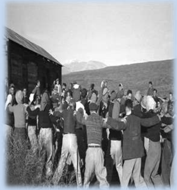
חברי קיבוץ רוקדים ושמחים