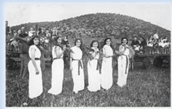
חג שבועות בקיבוץ